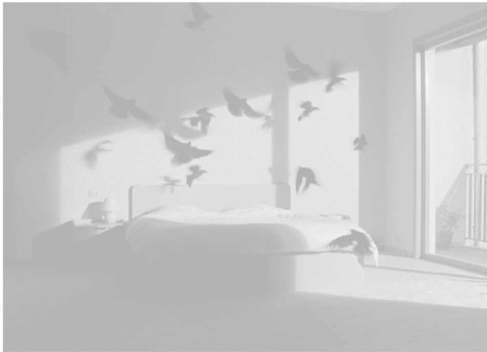
Als de vogels rondfladderen, werpen hun schaduwen een droomscène op de muren. © rr