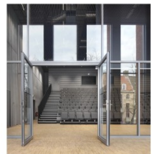
Het auditorium biedt zicht op de stad.

over de gehele breedte van het gebouw ook een terras bevindt. Veel congresgebouwen lijden aan een gebrek aan natuurlijk licht. In het BMCC ervaar je het daglicht bijna als een statement van duurzaamheid. Zo krijg je op de derde verdieping twaalf kleinere vergaderzalen rond een centrale gang. Dankzij de glazen wanden valt het licht royaal binnen, maar scheppen ze tegelijkertijd een grote ruimtelijkheid.